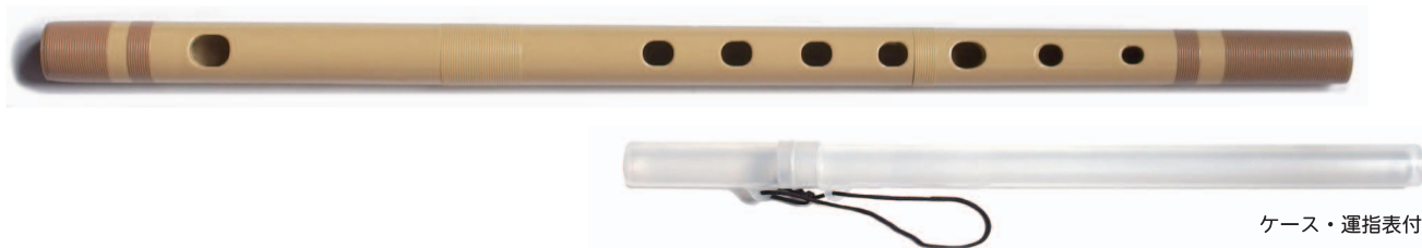
ケース・運指表付

学校の教材に適したプラスチック製の篠笛です。わらべ歌や桜などの日本の古い歌、三味線やお箏との合奏、太鼓と合わせた祭囃子など、様々な日本の曲を演奏することができます。